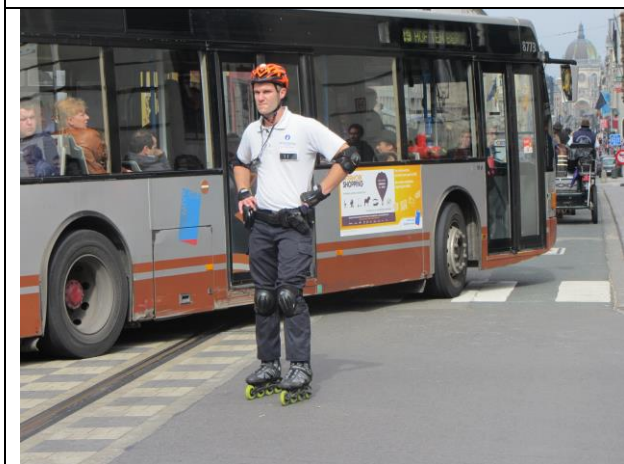
De bussen rijden wel, maar vandaag gratis en stapvoets. De agent doet mee op skates.