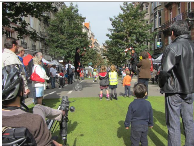
Leefstraat kunstgras midden op straat in de gemeente Sint Gillis