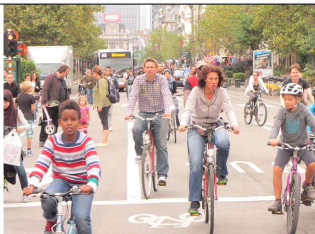
Een grote boulevard in het centrum