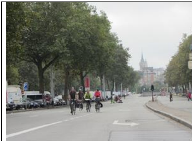
Agglomeratie Brussel ontwaakt vrij van autoverkeer, hier op het pentagoon, de anders drukke ringweg van 8 km om het centrum.