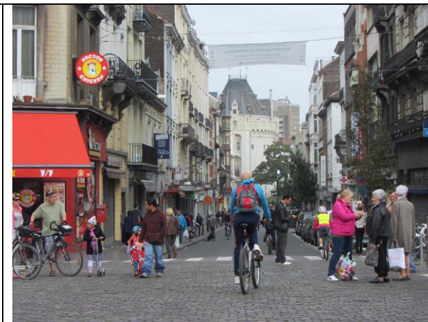
Sint Gillis, op de achtergrond de Hallepoort waar de ringweg loopt.